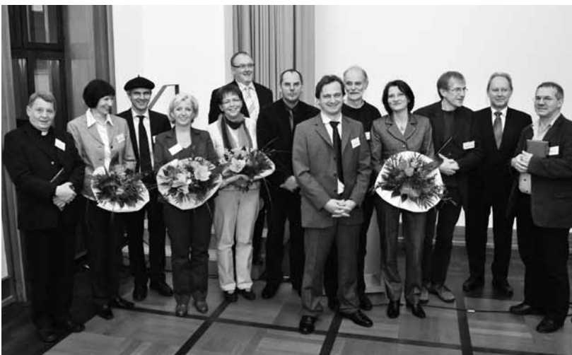
Die Referenten des 1. Augsburger Hospiz- und Palliativgespräch

Aus dieser Zusammenarbeit hat es sich ergeben, die ersten Augsburger Hospiz- und Palliativgespräche zu gestalten. Ein Tag mit bunt gemischten Informationen und Vorträgen vor allem für Fachpublikum aber auch für die Allgemeinheit. Referenten aus Augsburg, München, Erlangen, Berlin, Ravensburg und Fulda sprachen zu ganz verschiedenen Themen und hat- →