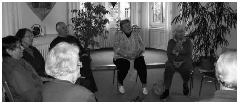
Teilnehmer des Gesprächskreises

Impressum: Herausgeber: Hospiz-Gruppe »Albatros« Augsburg e.V., Völkstraße 24, 86150 Augsburg, Telefon 08 21/3 85 44, Telefax 08 21/15 88 78, verantwortlich i. S. d. P.: Renate Flach, Doris Schneller